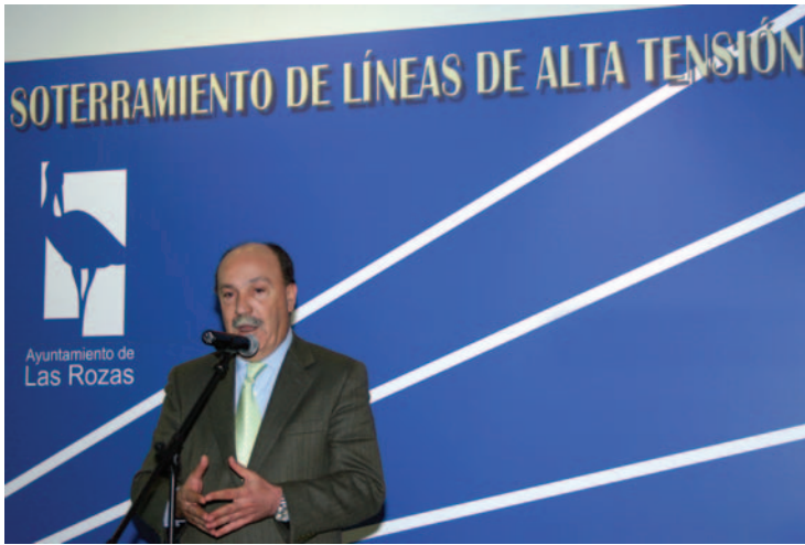
El Alcalde de Las Rozas en un momento de la presentación