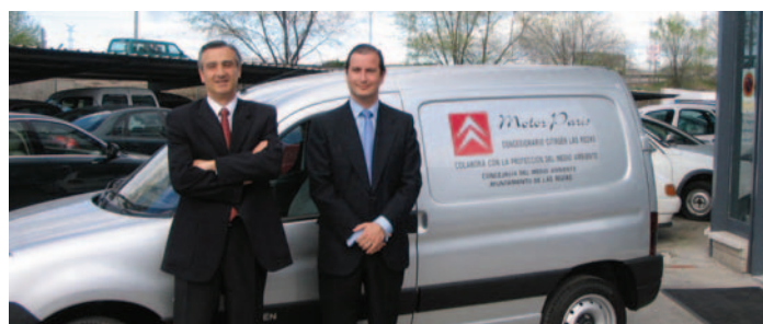
De izquierda a derecha, el gerente de Motor Villaverde y el Concejal de Medio Ambiente

Este convenio es muestra del espíritu de colaboración entre la Concejalía de Medio Ambiente y una empresa que ha recibido en varias ocasiones el reconocimiento de la Concejalía por los criterios medioambientales adoptados en la gestión de su taller, ubicado en el Polígono Industrial Európolis.