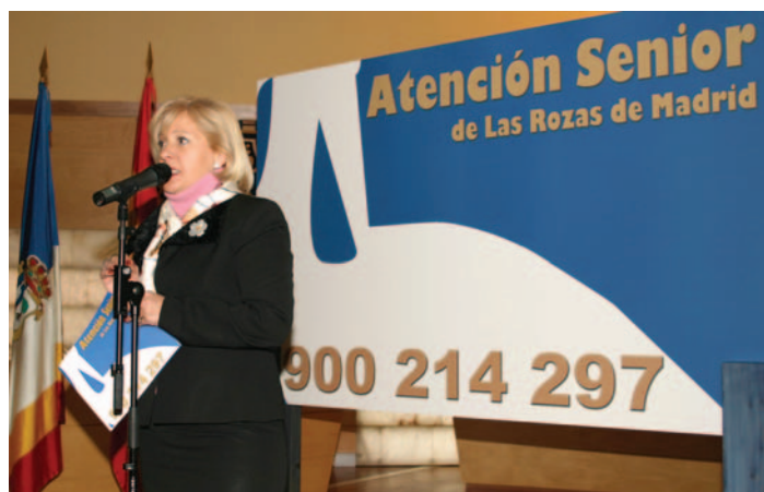
La Concejal de Igualdad de Oportunidades en un momento de la presentación

Además de médicos, atenderán este servicio psicólogos, abogados y diplomados sociales; un equipo capaz de atender situaciones personales de angustia, dudas legales, e incluso momentos de soledad y desconcierto. En la actualidad, podrían utilizar esta Tarjeta 6.800 personas, (correspondiente al número de mayores de 65 años censados en Las Rozas), aunque se estudia